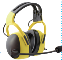
ベースユニット内蔵 ヘッドセット 機体との接続なし