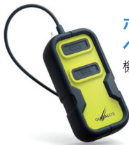
ボックス型 ベースユニット 機体との接続用

ボックス型のベースユニットを機体に接続する方法が一般的ですが、デアイシング作業のように機体への接続が不要の場合にはヘッドセットに内蔵されたベースユニットを使用することもできます。